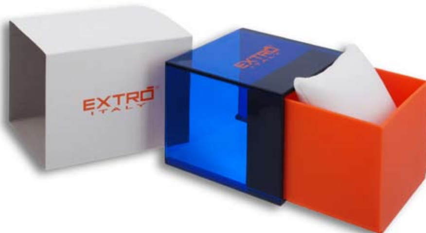
BOX PLASTIC ARANCIO 3